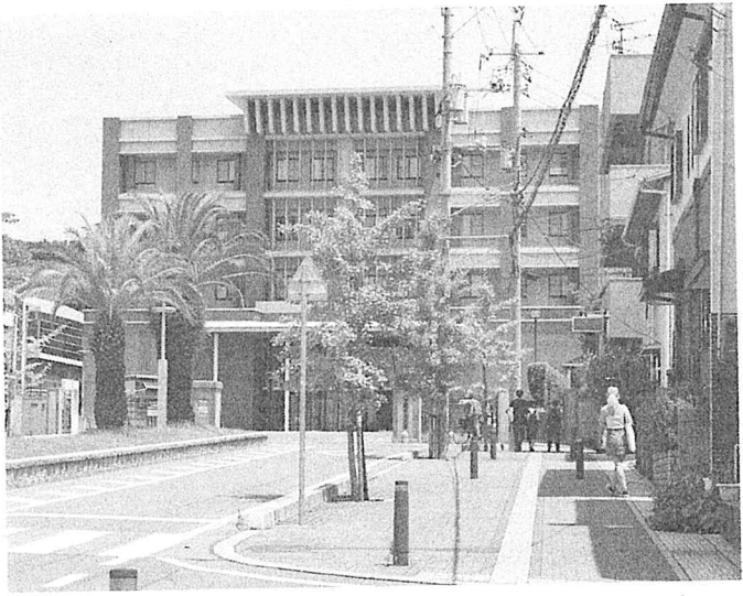
市大は市民と学生のもの。私物化は許されません(市大正面)