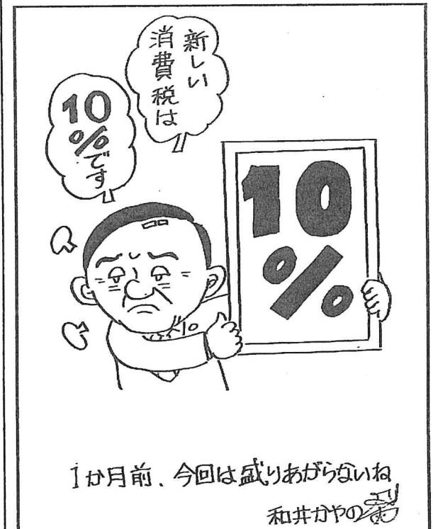
1か月前、今回は盛りあがりがないね 和井かやの

6月6日、山村理事長後、初の学内説明会で理事長は「市長のコネ人事」との出席者の批判に、「下関との関わりは濃い。余人をもって代え難い」と礼賛。後、A教授採用を決めたのは「やっぱり市長と私でしょうね」と認めました(6月20日)。