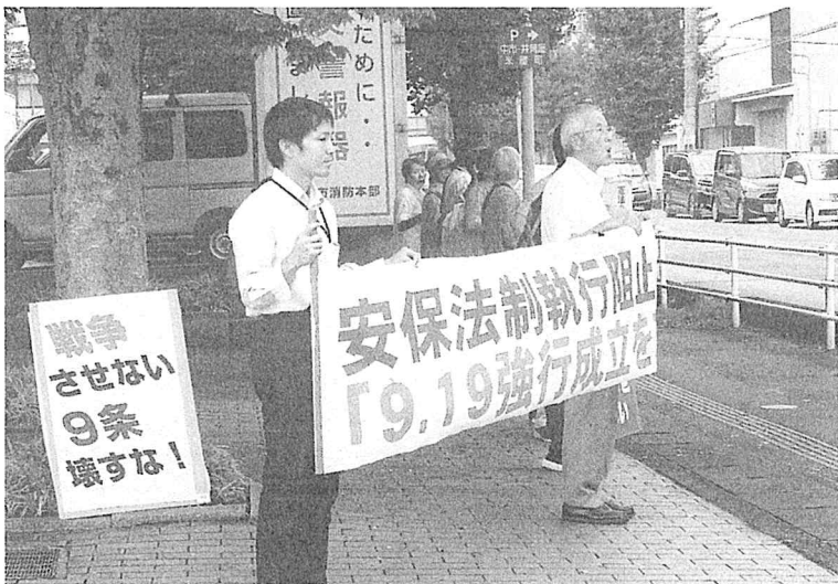
安倍改憲許さないと山口市民会館前での「9・19 忘れない行動」