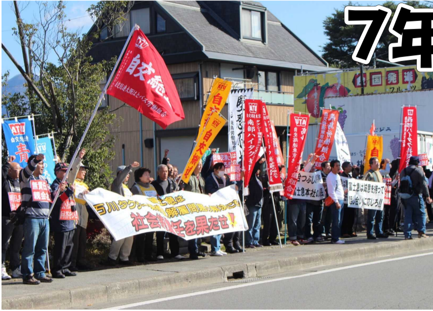
雨の日も、風の日も、暑い日寒い日も富士急本社へ抗議と要請を行った仲間たち＝富士急山梨本社前

〒422-8062 静岡市駿河区稲川2-2-1 セキスイハイムビルディング7階 TEL 054-287-1293 FAX 054-286-7973 Eメール kenpyo@mail.wbs.ne.jp